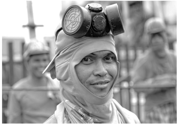
Un travailleur portant l'équipement de protection nécessaire pour déblayer et ramasser les débris, dans le cadre des programmes de l'OIT d'emplois d'urgence et «argent-contre-travail», et dans le cadre des efforts entrepris par l'OIT après le passage du typhon Haiyan (Yolanda), novembre 2013, Tacloban, Philippines.

Le DOLE est l'organe principal chargé de la mise en œuvre du programme DILEEP. En raison de la nature géographique du pays, la population est largement dispersée dans un total de 7 000 îles, ce qui oblige le DOLE à coordonner ses activités avec les bureaux régionaux et ses partenaires accrédités lors de la mise en œuvre des programmes de protection sociale. Les partenaires accrédités comprennent les unités administratives locales, les organisations gouvernementales et non