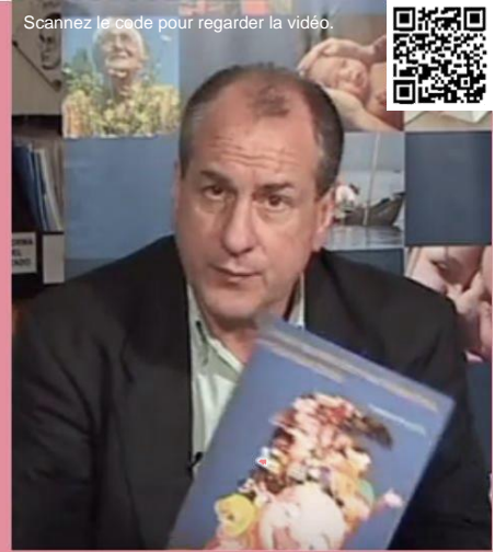
Ernesto Murro, ministre du Travail et de la Sécurité sociale d'Uruguay, présente le programme d'éducation à la sécurité sociale.

L'Uruguay a développé un programme d'Éducation à la sécurité sociale, administré conjointement par l'Institut national de sécurité sociale et le ministère de l'éducation. Ce programme a pour objectif d'améliorer les connaissances des jeunes générations sur les droits et obligations relatifs à la protection sociale, appuyant ainsi la formation de citoyens responsables et de futurs acteurs du système de protection sociale. Ce programme d'éducation à la protection sociale s'inscrit dans le cursus scolaire public. Les professeurs sont impliqués dans la production des supports d'apprentissage et responsables de la conduite des séances d'apprentissage. Ce programme a contribué à l'extension de la protection sociale à la totalité de la population.